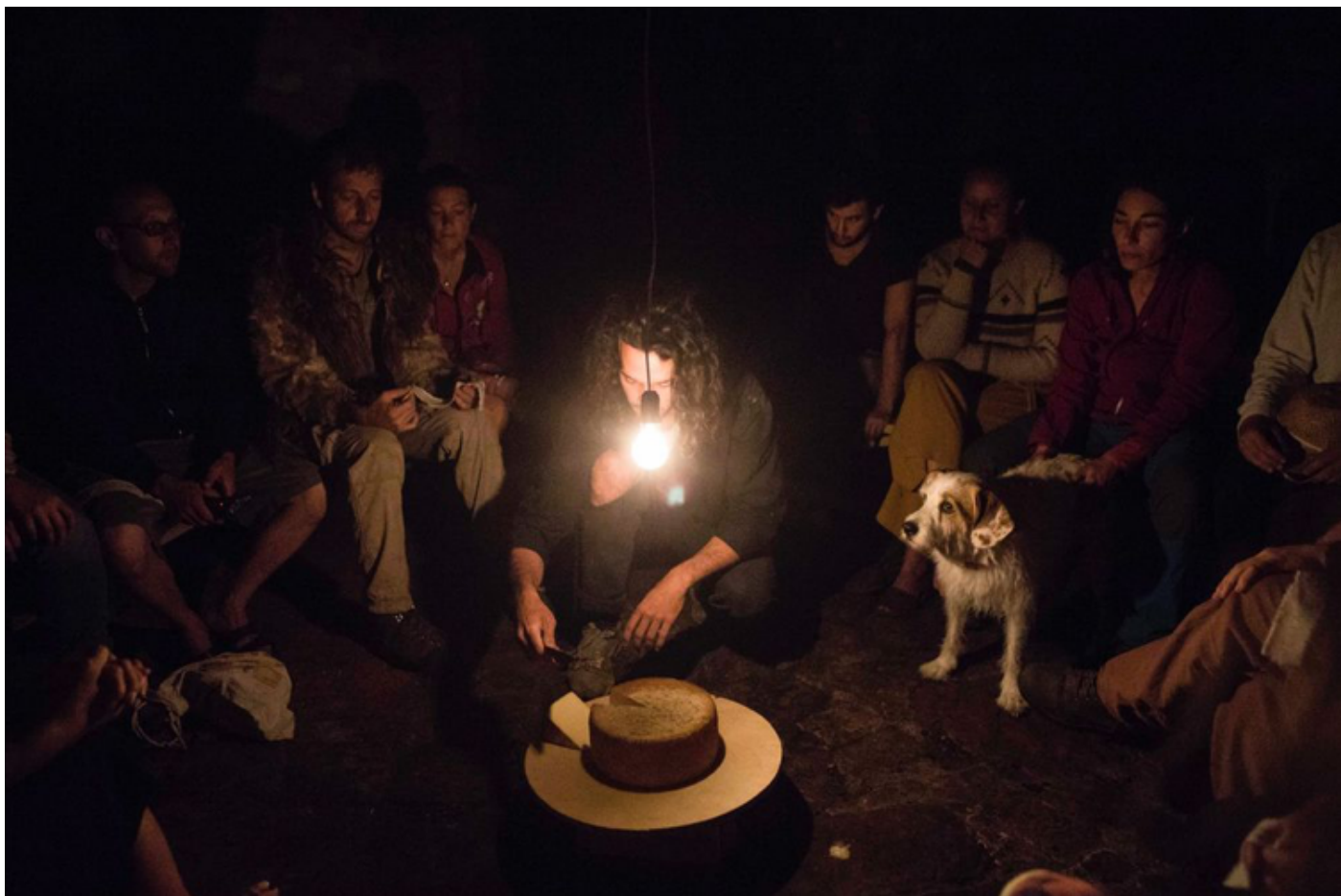
'Performance' del colectivo agroecologista INLAND, uno de los invitados a esta Documenta 15.

INLAND (o Campo Adentro) es una plataforma colaborativa que gesta vínculos entre arte y territorio. Lo integran diez miembros. El más visible es el artista y agroecólogo Fernando García-Dory. Trabajan con comunidades de proximidad y usan conceptos de economía radical con el fin de rescatar prácticas agrarias ancestrales o formatos que difuminan la frontera entre arte y artesanía, como la producción de panes performativos en el medio