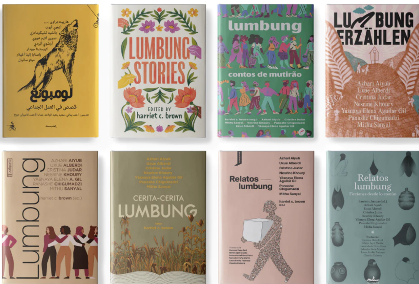
Las ocho ediciones de los catálogos de la Documenta 15, editados por Consonni.

hórreo donde se guarda el arroz) y se refiere a la manera de gobernar los recursos en su país. Entre los 70 grupos invitados a Kassel este año, figuran tres españoles: la editorial Consonni , el colectivo agroecologista INLAND, cuyo miembro más destacado es Fernando García-Dory , y el colectivo Recetas Urbanas , de Santiago Cirugeda. Lo que les caracteriza son “los afectos”, esas verdades sin retoques que salvan un entorno artístico cada vez más virtualizado.