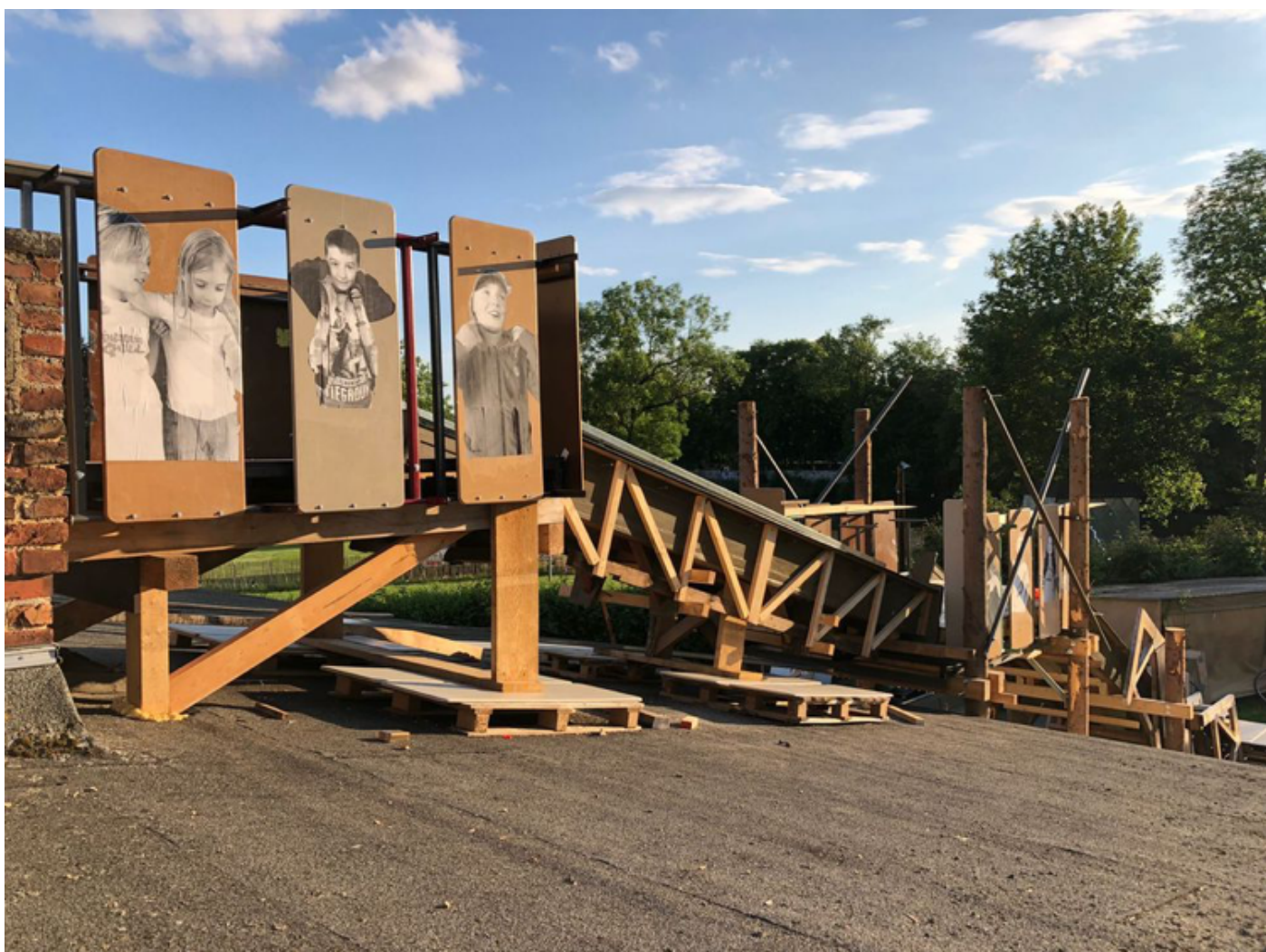
Una imagen del puente construido por Recetas Urbanas en Kassel (Alemania).

Dory que “el número de cheesecoins emitidos seguirá el patrón-queso, equivalente a la cantidad de kilos de queso que INLAND producirá en este evento. Los usuarios pueden mantener su saldo y subirlo a una nube, a través de una aplicación que les permite crear nuevos intercambios y formas de equivalencia, una manera performativa y conceptual de confrontar la fiebre por los NFT , la hipertecnologización y la acumulación individual, y poner en circulación otros valores”.