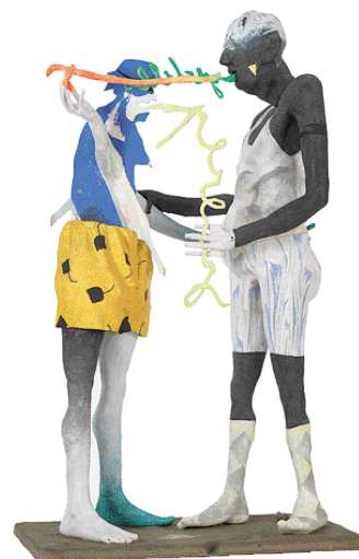
Galerista madrildarrak Benidormen

"Programa hau ez da gure eginbehar bakarra, baina inportanteenartikoa bat, bai"