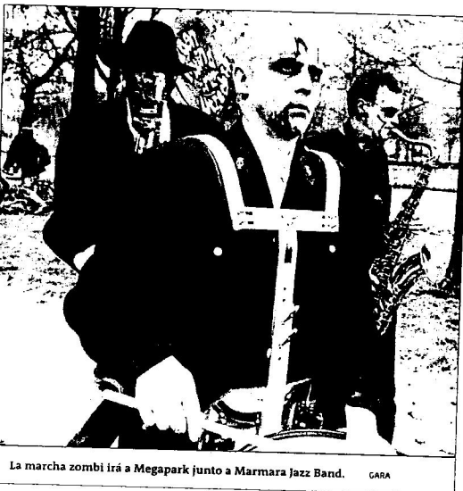
La marcha zombi irá a Megapark junto a Marmara Jazz Band.