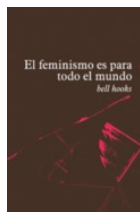
Hooks, Bell El feminismo es para todo el mundo

Diciembre 2019 Noviembre 2019 Octubre 2019 Septiembre 2019 Agosto 2019 Julio 2019 Junio 2019 Mayo 2019 Abril 2019 Marzo 2019 Febrero 2019 Enero 2019 Diciembre 2018 Noviembre 2018 Octubre 2018 Septiembre 2018 Agosto 2018 Julio 2018 Junio 2018 Mayo 2018 Abril 2018 Marzo 2018 Febrero 2018 Enero 2018 Diciembre 2017 Noviembre 2017