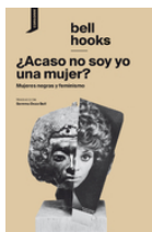
Hooks, Bell ¿Acaso no soy una mujer?