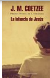
La infancia de Jesús