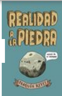
Realidad a la piedra