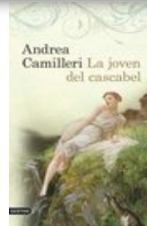
La joven del cascabel