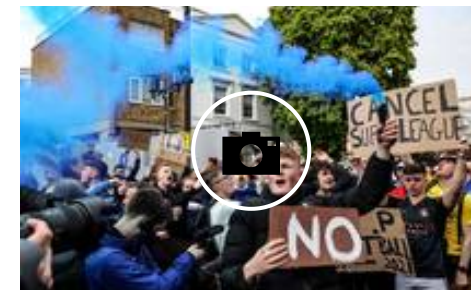
Las protestas en Inglaterra por el proyecto de la Superliga