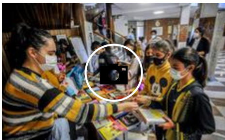
San Viator se transforma en Hogwarts