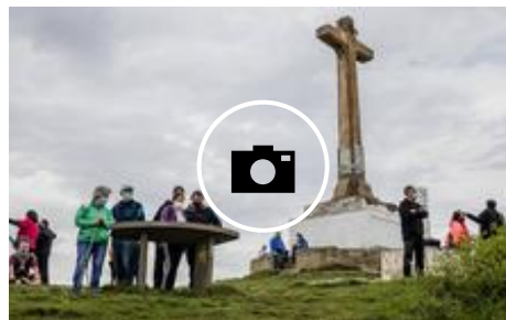
Un domingo junto a la cruz más famosa del momento