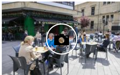
Primavera en mayúsculas este sábado en Vitoria