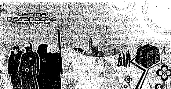
SU LUENGO. 'Vector Defenders I', obra en la Red de Luengo y On Click.

Todo un nuevo mundo para la creación de experiencias visuales, en fin, pero también toda una inmensa audiencia potencial para apreciar el arte espontáneo, libre e inmaterial. Así, con esos antecedentes, se entenderá fácilmente la importancia que tiene la organización en Bilbao de un festival multidisciplinar, 'ciber@rt', que no está únicamente dedicado al conocimiento visual de la nueva realidad artística, sino también al debate y al conocimiento de esa interacción bipolar y virtual entre la Red y el yo. Un tema de enorme actualidad y trascendencia, sobre todo en la vigencia actual de la cultura audiovisual, cuyo inmediato desarrollo va a condicionar tanto la creación artística como el siguiente cambio histórico.