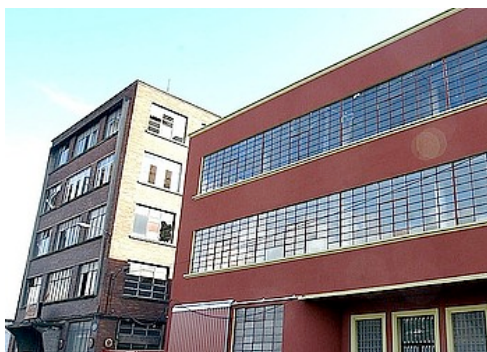
Consonni eraikina, Zorrotaurren.