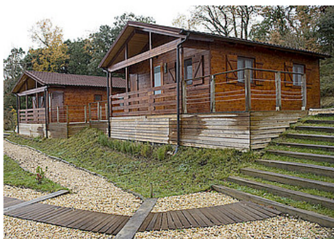
Azala sortzaileentzako landetxea, Arabako Lasierra herrian.