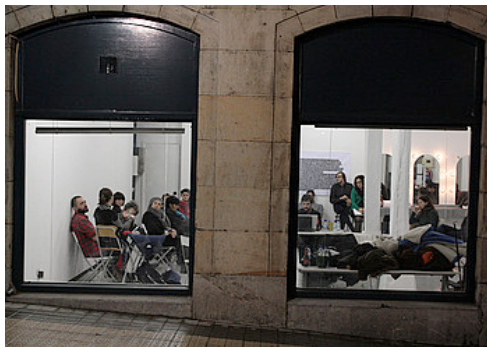
Bulegoa z/b, Solokoetxen, 2010eko abenduko ekitaldi batean.

Diziplinen arteko bidegurutze horrek jende gehiagorengana iristeko aukera ekarri diela irizten diote. «Diziplinak batzarekin batera, audientziak ere bildu ditugu. Oso positiboa izan da hori; erakunde