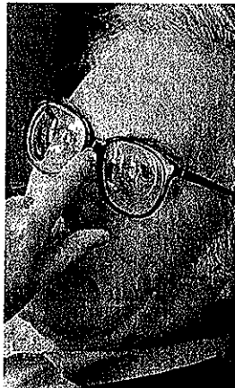
GANADOR. Francisco Umbral.

con cinco votos frente a cuatro, pero luego se inclinó por Umbral y se dio el empate. Otro miembro del jurado cambió entonces el sentido de su voto en favor del autor de 'Mortal y rosa', y así se produjo el desenlace en favor de este escritor por seis a cuatro.