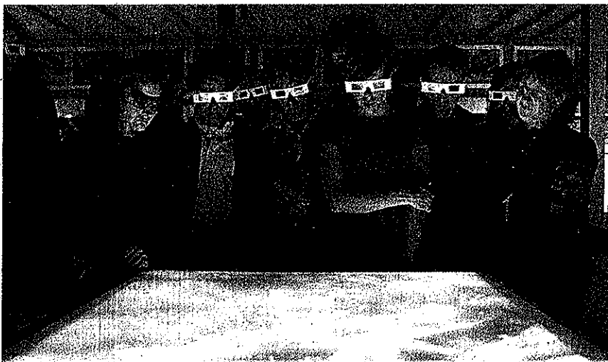
Visitantes el primer día de Ciberart, con gafas para visualizar imágenes en 3D.

Begoña Muñoz ya creó en 2001, para la muestra Gaur, Hemen, Orain', en el Museo de Bilbao, una transgresora acción que exigía la complicidad del público, al que invitaba a llevarse prestada a casa la mano en cerámica de la artista.