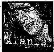
SO CALLED CHAOS (Maverick)

Imprescindible:★★★★ Excelente:★★★ Bueno:★★ Decentillo:★ Desechable:●